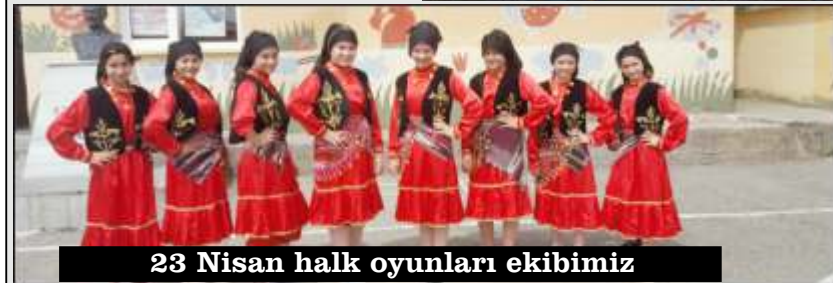
23 Nisan halk oyunları ekibimiz