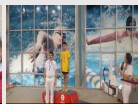
Yüzme yarışlarında 100m sırtta İl 1. olduk