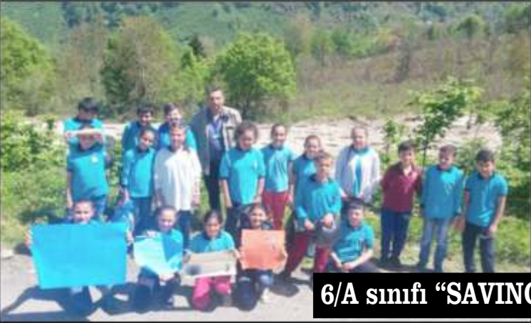
6/A sınıfı "SAVING THE PLANET" etkinliği