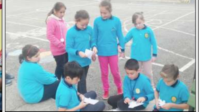
5/A sınıfı "GAMES AND HOBBIES" etkinliği