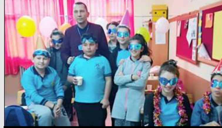
7/A sınıfı "PARTIES" etkinliği