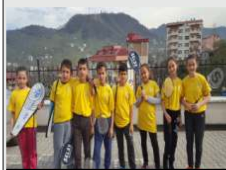
Küçükler ve yıldızlar kız- erkek badminton takımlarımız