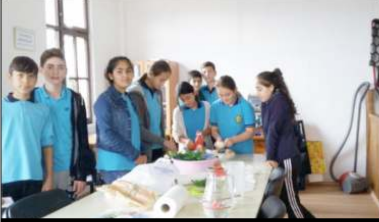
8/A Sınıfı "COOKING" etkinliği

"GAMES AND HOBBIES" etkinliğinde öğrencilerin el becerilerini geliştirmeye yönelik olarak "origami", motor becerilerini geliştirmeye yönelik olarak ise "hopscotch, dodgeball, tag, hide and seek" gibi oyun ve hobilerle ünite kazanımları pekiştirilmiştir.