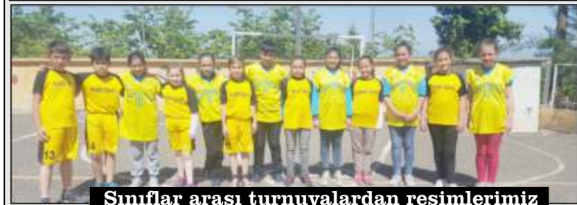
Sınıflar arası turnuvalardan resimlerimiz